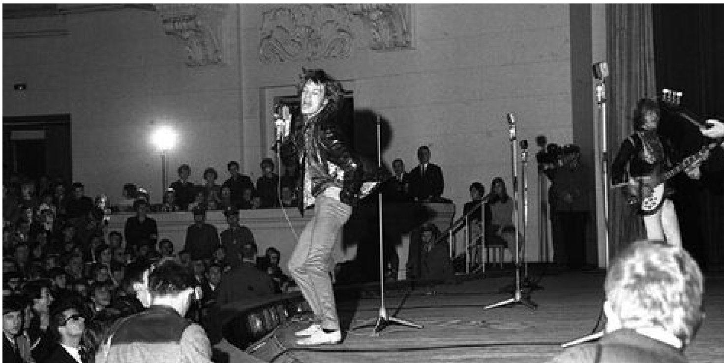
Koncert w 1967 r.

https://przystanekhistoria.pl/pa2/teksty/106639,The-Rolling-Stones-w-Warszawie.html