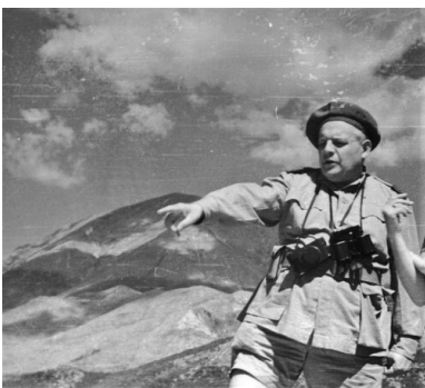
Melchior Wańkowicz po bitwie o Monte Cassino na szczycie

O tym, że ta książka do dziś cieszy się popularnością, decyduje umiejętność oddania nastroju walki. Wystrzały, pociski artyleryjskie wybuchają tuż obok nas. Słyszymy wydawane rozkazy, z żalem żegnamy poległych. Jesteśmy wraz z autorem dosłownie wszędzie tam, gdzie dzieje się coś ważnego związanego z walką. Wańkowicz był na polu bitwy od pierwszego do ostatniego dnia zmagania. Notował, obserwował, rozmawiał z uczestnikami wydarzeń. A potem mozolnie odtwarzał majowe wydarzenia na wzgórzu Monte Cassino. Wiedział, że musi się spieszyć. Wojna trwała, ludzie ginęli, zmieniali się dowódcy poszczególnych jednostek i składy pułków, batalionów, kompanii. Wańkowicz zatrzymał bitwę w czasie i zrobił to w sposób jedyne w swoim rodzaju.