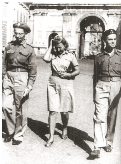
Marian Szyszko-Bohusz, Maria Szelałowska, Witold Pilecki. Rzym, wrzesień 1945

„Myślę, że jest to najpiękniejsze wydawnictwo, jakie ukazało się w języku polskim od września 1939 roku”.