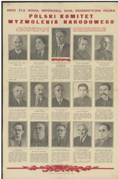
Skład Polskiego Komitetu Wyzwolenia Narodowego. Afisz Wydawnictwa Resortu Informacji i Propagandy PKWN z 1944 r.

Witos, Stanisław Kotek-Agroszewski czy, nieco później, Bolesław Drobner) byli eliminowani z kierownictw tych ugrupowań. Niekiedy motywy przejścia na stronę komunistów były bardziej złożone. Organizatorem na przykład współpracującego z nową władzą ugrupowania, mającego obejmować katolików, został Bolesław Piasecki, założyciel ONR-Falangi, znany ze zdecydowanego, wręcz skrajnie antykomunistycznego nastawienia.