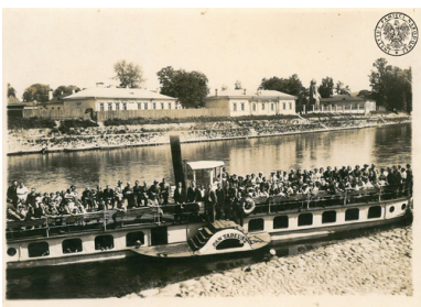
Zdjęcie z wycieczki do Wilna. Statek wycieczkowy „Pan