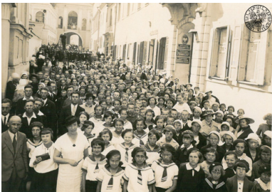
Zdjęcie z wycieczki do Wilna. Fotografia zbiorowa wykonana przed Ostrą Bramą. Autor: J. Łoziński (fot. z zasobu IPN)