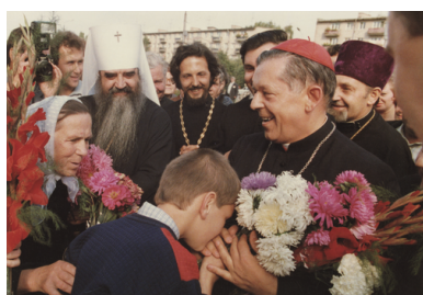
Powitanie prymasa Józefa Glempa przez Polaków w Grodnie, 5 IX 1988 r.; po lewej, w białym kłobuku, metropolita Filaret

Jej znaczenie było wielorakie. Na Białorusi, zwłaszcza w obwodzie grodzieńskim, żyła liczna polska mniejszość narodowa, a miejscowi katolicy nie mieli żadnego biskupa. Prymas przebywał na Białorusi od 5 do 7 września 1988 r. i był m.in. gościem prawosławnego metropolity mińskiego Filareta (Kiryła Wachromiejewa) 16 . Filaret, jako przewodniczący Wydziału Kościelnych Stosunków Zewnętrznych Patriarchatu Moskiewskiego w latach 1981-1989, był partnerem dyplomacji Stolicy Apostolskiej m.in. w sprawach organizacji obchodów Milenium Chrztu Rusi Kijowskiej. Kardynał Glemp rozmawiał z nim już w Moskwie i prawdopodobnie wówczas narodził się plan wyjazdu do Mińska. Prymas odwiedził prawosławne i katolickie świątynie w Grodnie, Lidzie, Nowogródku, Mińsku, Nieświeżu, Pińsku i Brześciu.