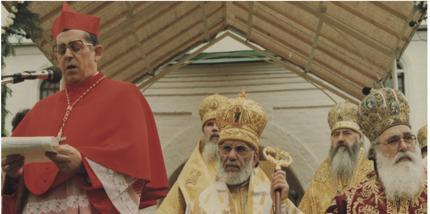
Liturgia centralnej uroczystości Milenium Chrztu Rusi w klasztorze Daniłowskim, Moskwa, 12 VI 1988 r.; pierwszy z prawej metropolita miński Filaret, wiceprzewodniczący synodalnej komisji przygotowującej obchody (fot. Archiwum Archidiecezji Warszawskiej)

https://przystanekhistoria.pl/pa2/tematy/bialorus/89186,Historyczna-misja-prymasa-Glempa.html