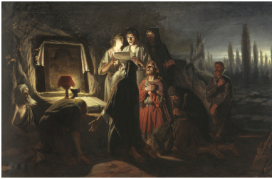
Pierwsi chrześcijanie w Kijowie - obraz Wasilija Pierowa, 1880 r.

Aktywność Józefa Glempa należy postrzegać w kontekście szerszych uwarunkowań związanych z ówczesnymi relacjami między Związkiem Sowieckim a Stolicą Apostolską. Dojście do władzy Michaiła Gorbaczowa i zapoczątkowane przez niego reformy stwarzały możliwości poszerzenia obszaru wolności dla Kościoła w ZSRS. Dlatego aktywność prymasa Polski stała się częścią misji Stolicy Apostolskiej wobec Związku Sowieckiego i krajów Europy Wschodniej 1 .