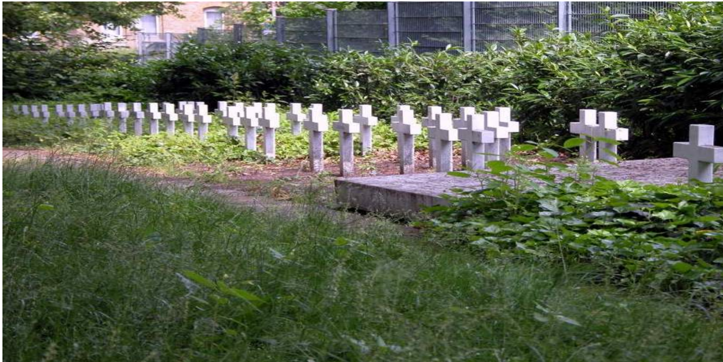
Cmentarz przy Hochstraße w Brunzwicku

https://przystanekhistoria.pl/pa2/tematy/dzieci/102061,Tragiczne-losy-polskich-robotnic-przymusowych-i-ich-dzieci-Dzialalnosc-zakladu-p.html