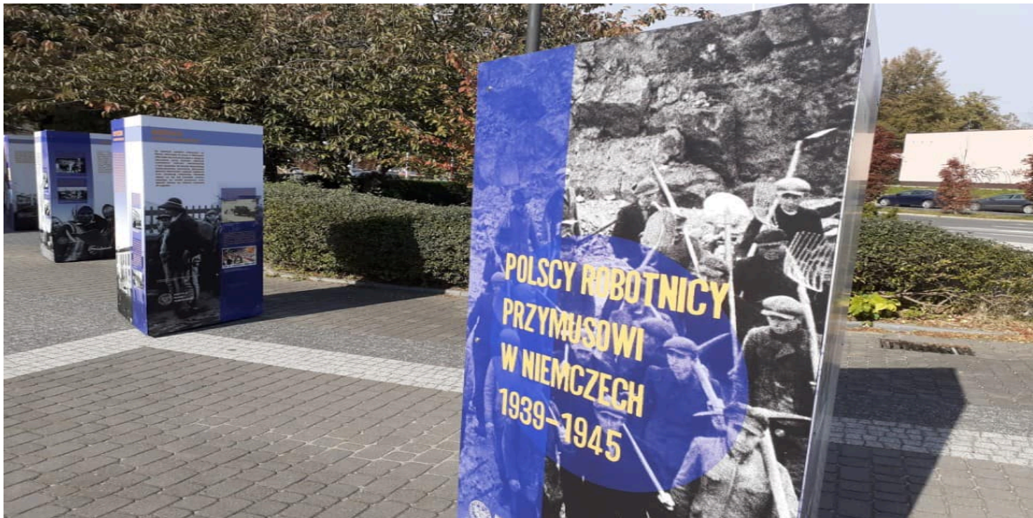
Wystawa "Polscy robotnicy przymusowi w Niemczech 1939-1945" - Łódź, 12-29.10.2021 r.

https://przystanekhistoria.pl/pa2/tematy/dzieci/105156,Zbrodnie-popelnione-na-dzieciach-polskich-robotnic-przymusowych-osadzonych-w-obo.html