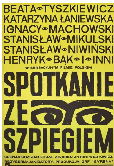
Plakat filmu "Spotkanie ze szpiegiem" (1964 r., reż. Jan Batory)

takiej akcji jest choćby „Operacja Pretorius”, czyli plan niemieckiego ataku na Nowy Jork.