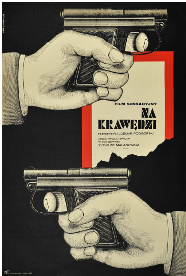
Plakat filmu "Na krawędzi" (1972 r., reż. Waldemar Podgórski)