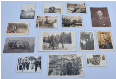
Zbiór fotografii rodzinnych Jadwigi i Zofii Klimkiewicz