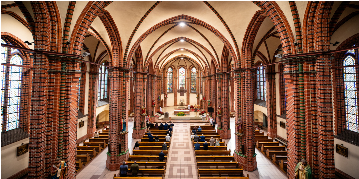
Kościół św. Apostołów Piotra i Pawła w Katowicach, 2023 r.

https://przystanekhistoria.pl/pa2/tematy/kosciol/105051,Kosciol-z-pomoca-poszkodowanym-w-stanie-wojennym-Diecezja-katowicka.html