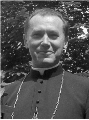
Bp Czesław Domin, 1982 r.

bp. Czesławem Dominem odprawił on Mszę św. w zakładzie karnym w Jastrzębiu-Szerokiej 1 stycznia 1982 r. 3 .