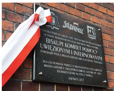
Tablica pamiątkowa na kościele św. Apostołów Piotra i Pawła w Katowicach

Sekcja informacyjna była odpowiedzialna za prowadzenie szczegółowej ewidencji osób represjonowanych. Temu celowi miały służyć specjalne kartoteki, które dotyczyły m.in. osób internowanych, skazanych, zwolnionych z pracy oraz wyrzuconych ze szkoły. W kartotece były podane: data i powód aresztowania, okoliczności, rodzaj wymierzonej kary, stan zdrowia, nazwisko sędziego, przynależność do Solidarności, sytuacja rodzinna oraz rodzaj pomocy, jakiej potrzebuje osoba internowana i jej rodzina.