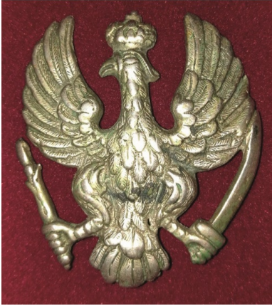
Orzełek powstańczy znaleziony na ziemiach zabranych.