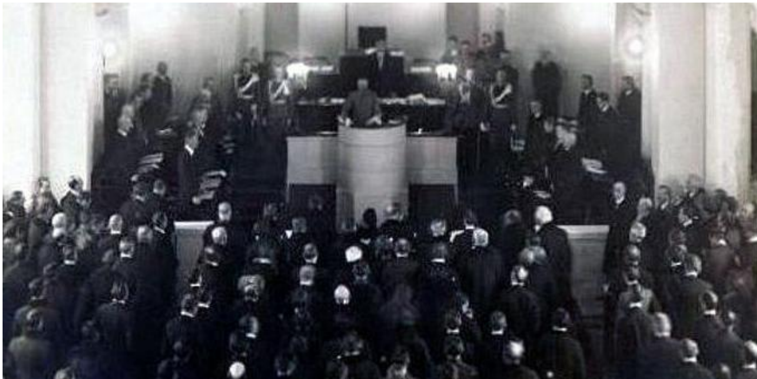
Sejm, 10 II 1919 r.

https://przystanekhistoria.pl/pa2/tematy/niepodleglosc/87709,Zycie-polityczne-w-Polsce-pierwszych-lat-niepodleglosci.html