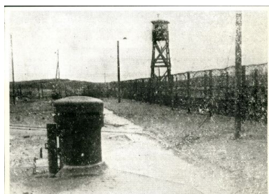
Obóz w Żabikowie.

Szacuje się, że z Żabikowa odeszło do obozów koncentracyjnych 28 transportów z więźniami. Przez tutejszy lagier przewinęło się w sumie ponad 21 tysięcy osób. Wielu więźniów przebywało w Żabikowie kilka miesięcy, a tylko nieliczni zostali stąd zwolnieni. W obozie więźniowie byli przesłuchiwani przez gestapo. Wykonywano tutaj również wyroki śmierci. Na porządku dziennym były tortury i znęcanie się nad osadzonymi.