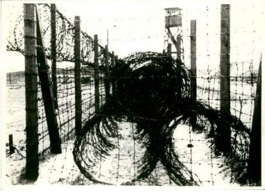
Obóz w Żabikowie. Fot. z zasobu