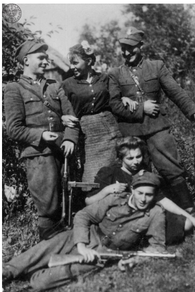
Wspólne zdjęcie partyzantów V Wileńskiej Brygady AK z