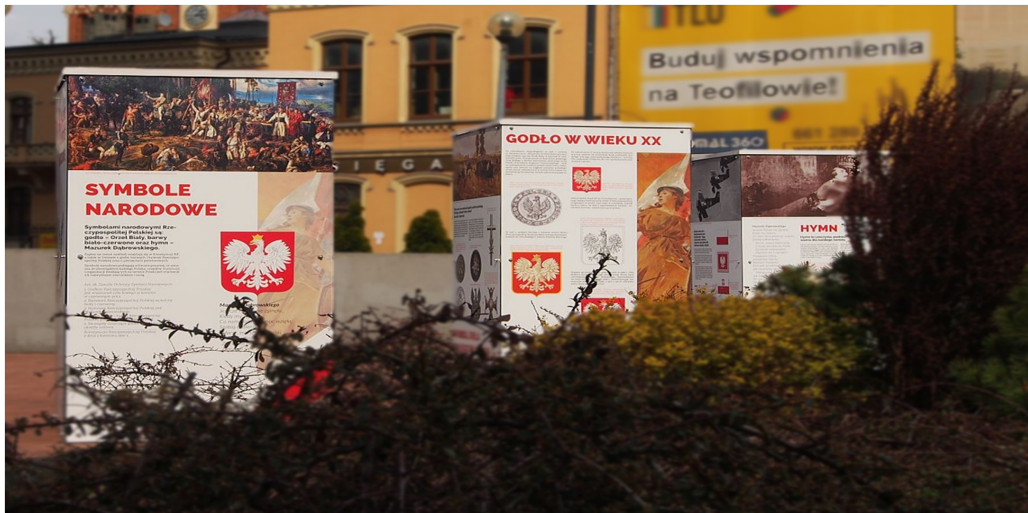
Wystawa IPN „Polskie Symbole Narodowe” - Łódź, 2021 r.

https://przystanekhistoria.pl/pa2/tematy/transformacja-ustrojowa/90019,Miedzy-symbolika-niepodleglosciowa-a-cieniem-totalitaryzmu.html