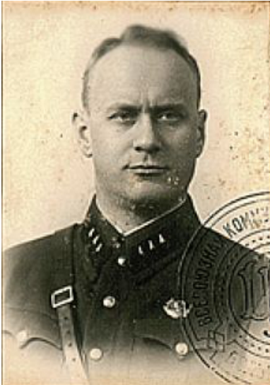
Iwan Sierow.