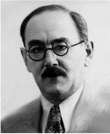
Imre Nagy.