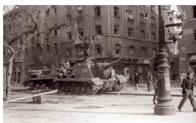
Zniszczone sowieckie haubice szturmowe na bulwarze przy zaułku Corvina.

Wjazd czołgów miał na celu wywołanie popłochu wśród demonstrantów i zmuszenie ich do odwrotu. Podobną akcję – z oczekiwanym rezultatem – przeprowadzono w 1953 r. w Berlinie Wschodnim. Tymczasem 24 października czołgi Lebiediewa, które o świcie pojawiły się na pl. Barárosa w Budapeszcie, przez zorganizowanych w ciągu kilku godzin węgierskich powstańców zostały przywitane salwą ognia i koktajlami Mołotowa.