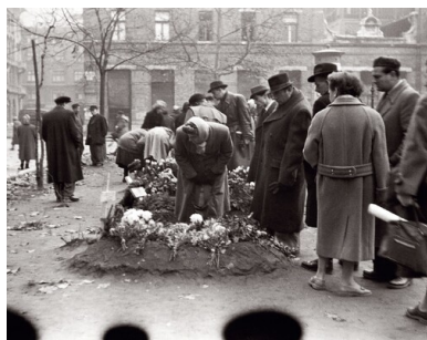
Groby ofiar powstania węgierskiego, pl. Rákóczi,

Hannah Arendt, wybitna amerykańska politolog badająca działanie systemów totalitarnych, węgierski Październik '56 określiła mianem jedynej w historii prawdziwej rewolucji, której uczestników mobilizowały nie postulaty socjalne, lecz pragnienie uzyskania wolności, odmiany świadomości i stanu ducha udręczonych jednostek oraz przywrócenie godności całemu społeczeństwu. To Arendt powiedziała, że węgierski duch 1956 r. jest niegasnącym światłem ludzkości.