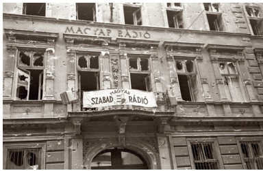
Budynek Węgierskiego Radia, 1956 r.; transparent z napisem „Wolne Radio Węgierskie”. Fot. Fortepan/Gyula Nagy (za: „Biuletyn IPN” numer 10/2021)