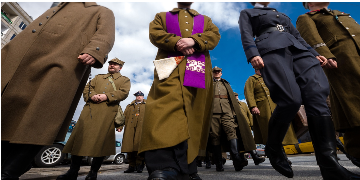
XV Katyński Marsz Cieni - Warszawa, 3 kwietnia 2022.

https://przystanekhistoria.pl/pa2/tematy/zbrodnia-katynska/101865,Ks-Jan-Leon-Ziolkowski-1889-1940.html